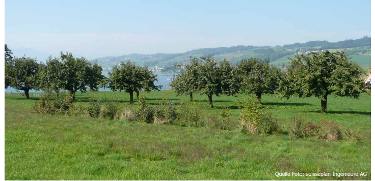
Artenreiche Niederhecke als Vernetzungsachse