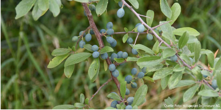
Der Schwarzdorn ( Prunus spinosa ) bietet Schutz und Nahrung für Vögel.

Einheimische Gehölze sind wertvolle Elemente in unserer Landschaft. Sie bilden wichtige Trittsteine und Vernetzungsachsen. Sie bieten wertvolle Verstecke, Nist- und Eiablageplätze sowie Nahrung für viele unserer Tierarten. Im Siedlungsgebiet tragen Gehölze durch Schatten und Verdunstung zur Kühlung der Umgebung bei. Um den Wert von einheimischen Gehölzen aufzuzeigen, ist es wichtig das Wissen beziehungsweise positive Emotionen bei der Bevölkerung zu fördern. Mit den suisseplan-Pflanzentafeln bieten wir Ihnen eine attraktive und informative Möglichkeit dazu.