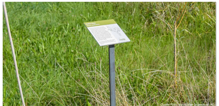
Die suisseplan-Pflanzentafeln können einfach in den Boden gesteckt werden.