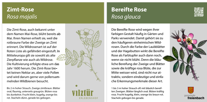
Das Design kann nach Wunsch angepasst werden.