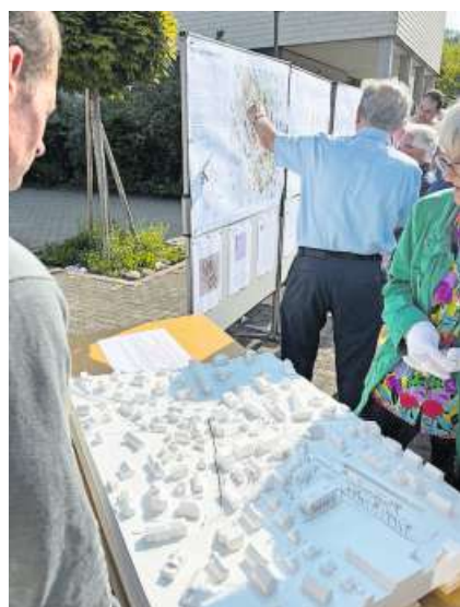
Rege wurden die vorgelegten Projekte diskutiert.

2019 hat die Gemeindeversammlung einen Planungskredit von 280 000 Franken für die Erarbeitung einer Ideenstudie für das Hedinger Zentrum genehmigt. Drei Planungsteams haben nun ihre Ideen zur Neugestaltung des Dorfkentrums und Projektvorschläge ausgearbeitet. Diese wurden am vergangenen Samstag im Schulzentrum Schachen der Öffentlichkeit präsentiert.