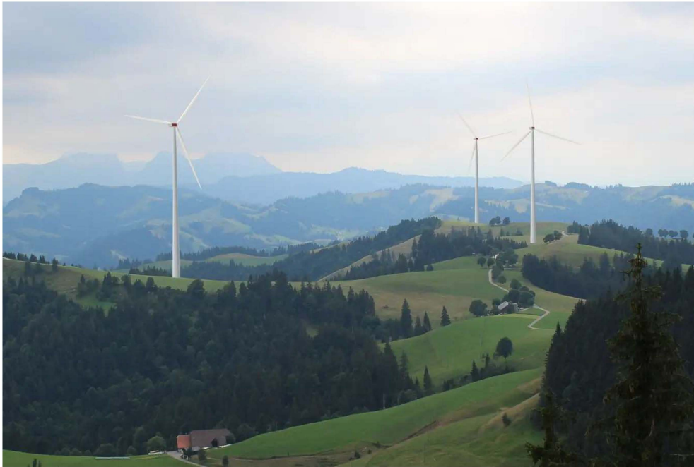
Der geplante Windpark oberhalb von Escholzmatt. Visualisierung: WES

Mehrere Projekte sind in Planung. Eines der fortgeschrittensten befindet sich in Escholzmatt. Die Windenergie Schweiz (WES) AG plant im Gebiet Höch-Turner-Bock einen Windpark mit drei Anlagen. Am Montagabend haben die Verantwortlichen die Bevölkerung informiert. Der Anlass stiess mit rund 200 Teilnehmenden auf reges Interesse.