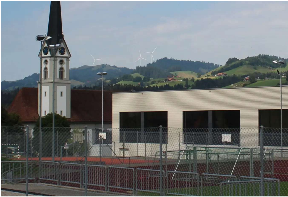
Der Windpark von Schüpheim aus gesehen. Visualisierung: WES