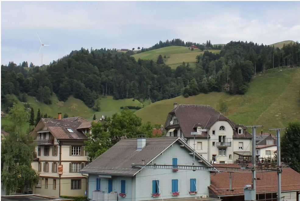
Von Escholzmatt aus sieht man eines von drei Windrädern. Visualisierung: WES

Insgesamt habe sich gezeigt, dass der Windpark in Escholzmatt erfolgreich umsetzbar sei. Die gesamte Investitionssumme beträgt laut Nigg rund 35 Millionen Franken. Die Firma konzipiert das Projekt – wie übrigens auch ein weiteres WES-Vorhaben in Pfaffnau und Reiden – als sogenannten Bürgerwindpark. Das heisst, alle Einwohnerinnen und Einwohner der Gemeinde Escholzmatt-Marbach können sich mit Anteilscheinen ab einem Mindestbetrag von 1000 Franken beteiligen. Die Zeichnung sei möglich, sobald die Baubewilligung vorliege. Für das fehlende Eigenkapital kommen laut Nigg Investoren zum Zug. Als Rendite für die Bürger gibt die WES 6 bis 7 Prozent an.