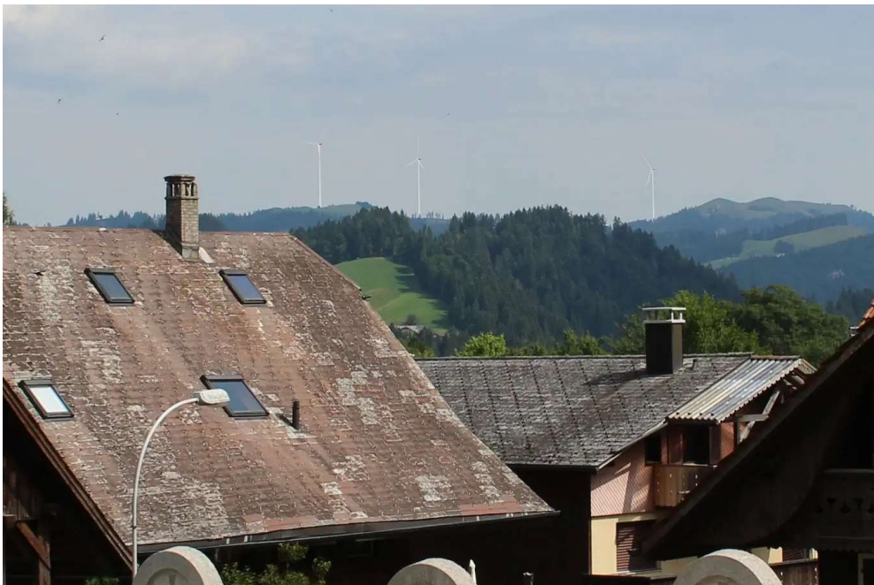
Der Windpark von Marbach aus gesehen. Visualisierung: WES