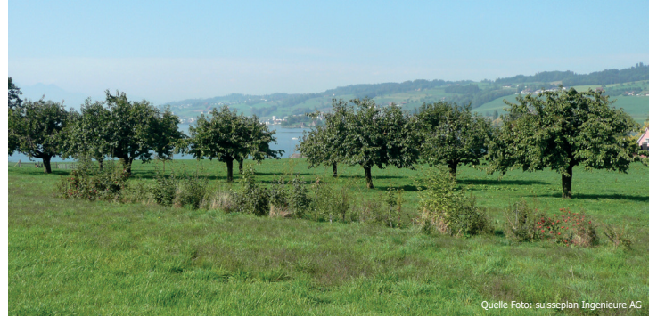
Artenreiche Niederhecke als Vernetzungsachse