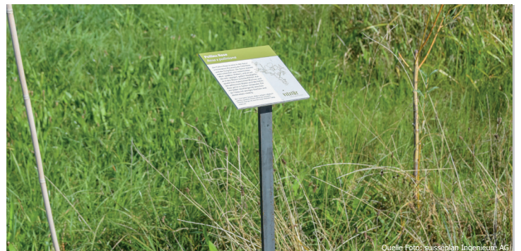
Die suisseplan-Pflanzentafeln können einfach in den Boden gesteckt werden.