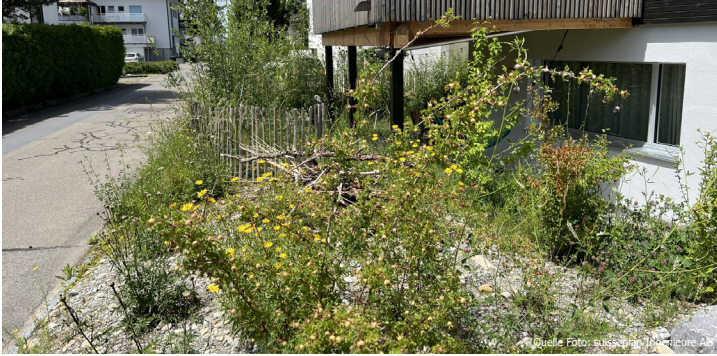
Besonnte Ruderalflächen sind attraktive und dynamische Lebensräume.

Privatgärten sind Orte der Entspannung. In diesen persönlichen Freiräumen wird der Rhythmus der Jahreszeiten spürbar. Darüber hinaus erfüllt ein Garten wichtige ökologische Funktionen. Er bietet auch Lebensraum für eine Vielzahl von Pflanzen- und Tierarten. Das suisseplan-Team unterstützt Sie dabei, unterschiedliche Massnahmen zur Förderung der Biodiversität im Privatgarten einem breiten Publikum vorzustellen. Dabei werden Möglichkeiten aufgezeigt, wie sich mit natürlichen Materialien wertvolle Lebensräume für Menschen, Tiere und Pflanzen schaffen lassen.