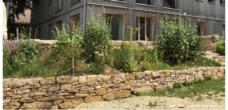
Trockenmauern strukturieren Gärten und bieten Lebensraum für Tiere.