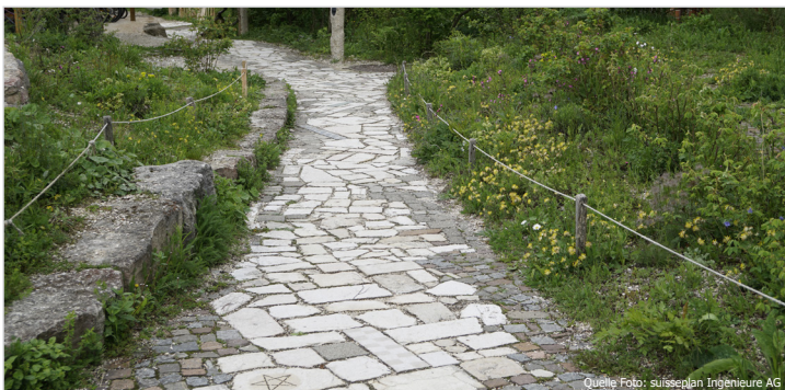
Unversiegelte Beläge lassen Regenwasser versickern.