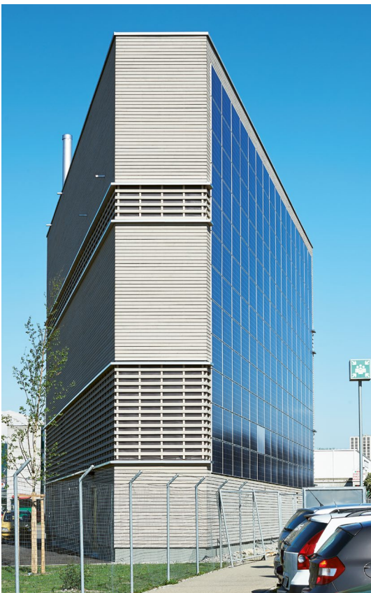
Energiezentrale ewz Aargauerstrasse

suisseplan betreute als Generalplaner und Fachplaner diverse Energie- und Seewasserzentralen, welche mittlerweile meist direkt in BIM geplant werden