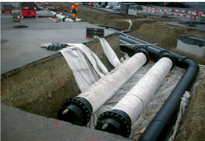
Anergie-Auskopplung ARA Werdhölzli