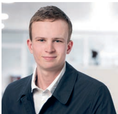
Loris Faiss Niederlassung Aarau