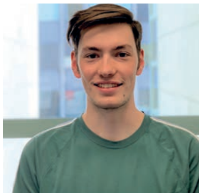
Julian Stöckli Niederlassung Wohlen